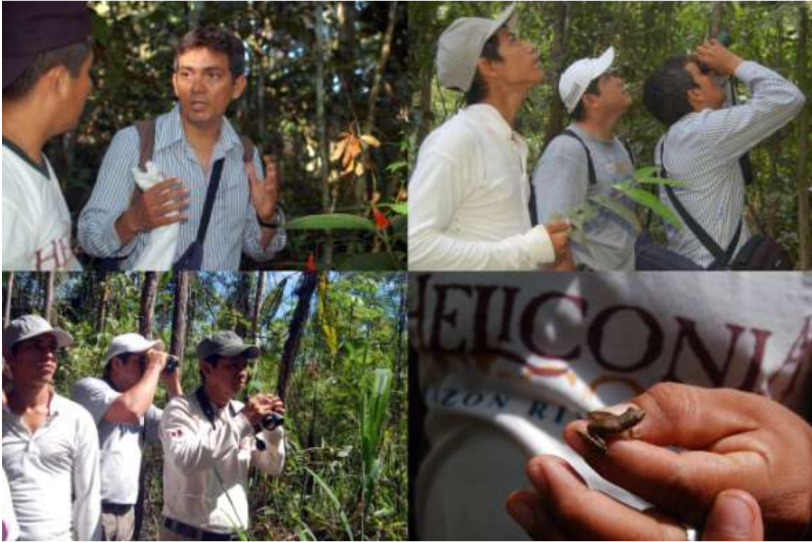
Figura 2. Clases prácticas de botánica, ornitología y herpetología en Heliconia Lodge