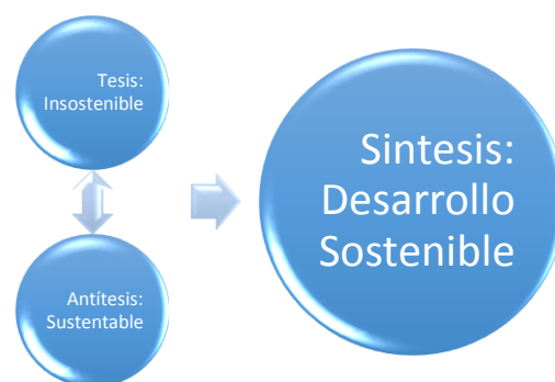
Ilustración 1: La triada dialéctica de lo sostenible

Veámoslo esquemáticamente, y démosle nombre a cada una de las piezas que integran la triada: