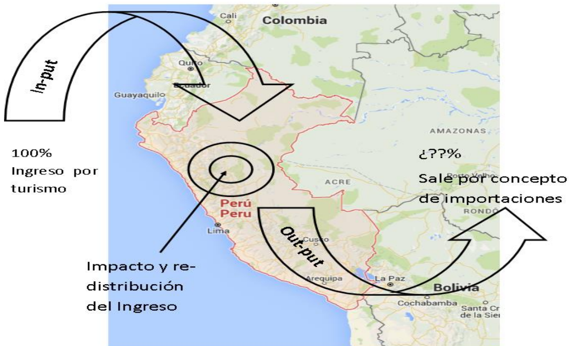
Ilustración 2: Impacto económico del turismo