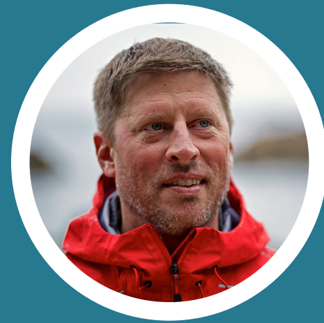
Shannon Stowell, CEO Adventure Travel Trade Association

La salud y la seguridad siempre han sido factores relevantes en el turismo responsable de aventura. La pandemia Covid-19 añade una capa de riesgo de una enfermedad que es transmisible tanto en la vida diaria como en las experiencias de viaje. Estos lineamientos proporcionan un camino hacia una reapertura organizada y más segura para la industria de los viajes de aventura, al proporcionar un conjunto común de acciones que pueden ser utilizadas por una amplia gama de negocios y proveedores de servicios en toda la cadena de suministro de la industria del turismo de aventura.